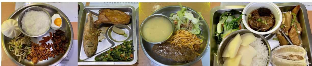
新海研 1 號上多樣化的飲食